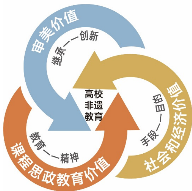
图2 高校非遗教育的三项价值核心

为避免非遗技艺的文化断层，高校纺织服装技艺教育应紧紧围绕教育与精神、手段与目的、继承与创新三个层面的价值理念开展非遗技艺的活化工作，促进大学生对非遗知识的内化（图2）。